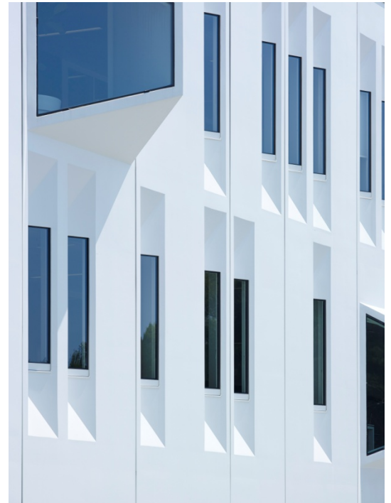
Gevelontwerp: Atelier Pro

Plaats: Peter Schmid Auditorium, Service-instituut VIBA-Expo, Veemarktkade 8, gebouw F, De Gruyter Fabriek, 's-Hertogenbosch